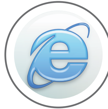
Microsoft Internet Explorer